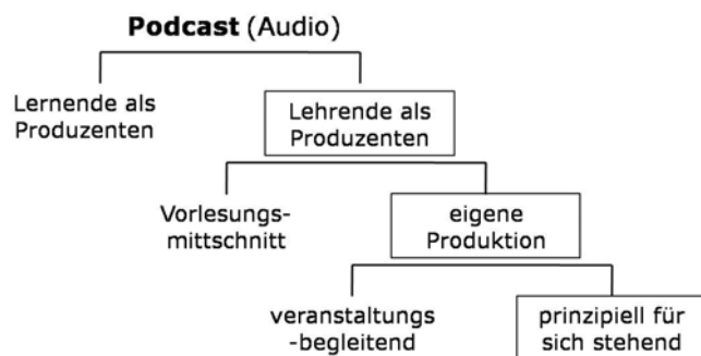
Abb. 2: Eingrenzung: Podcast-Form

Zu dem Zweck 2 ist es notwendig, die Podcast-Diskussion klar einzugrenzen, nämlich auf Audio-Podcasts (versus multimedial angereicherte Podcasts) im akademischen Kontext (versus Unterhaltungskontext), die vom Lehrenden als prinzipiell für sich stehendes Angebot produziert werden (Abb.2).