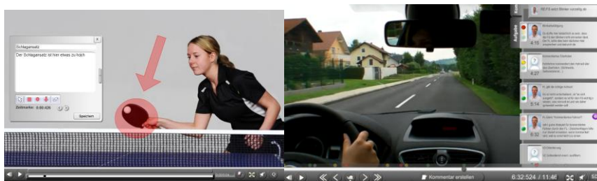
Abb. 1: edubreak®-Videoannotation (individuell und kollaborativ) im Kontext Sport und Fahrschule

In der folgenden Abbildung (Abb. 1) sieht man Beispiele von Videoannotationen mit unterschiedlichen Annotationstypen (Text, Zeichnungen und Ampelbewertungen) aus den besprochenen Kontexten.