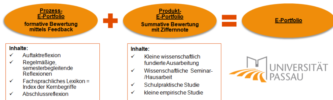
Abb. 2: Aufbau der E-Portfolio- und Reflexionsarbeit an der Universität Passau, Eigene Darstellung

Das E-Portfolio am Lehrstuhl für Erziehungswissenschaft mit dem Schwerpunkt Diversitätsforschung und Bildungsräume der Mittleren Kindheit besteht aus einem Prozess- und einem Produkt-E-Portfolio, wie in Abbildung 2 dargestellt.